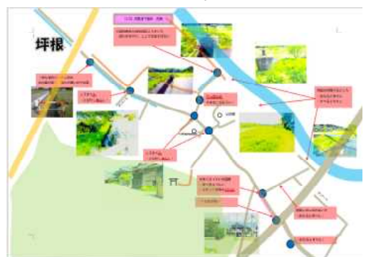
↑ 町内ごとの安全マップ

今年度は、職員ができる範囲で危険箇所の確認をして、子どもたちに気を付けるよう指導したいと考えています。「自分の命は自分で守る」ことを呼びかけ、安心・安全な生活をさせたいものです。