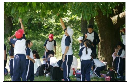
昨年度のふれあいウォークのひとコマ

山辺里小学校では、毎年ふれあいウォークを実施しています。年度当初より、感染症の状況によっては難しいと職員一同悩みましたが、規模を縮小してでも今やるのが大切と考え実施することとしました。それは、縦割り班ごとに活動のめあてを立て、みんなでめあてに向かって頑張ることが仲間づくりには欠かせないからです。また、高学年は今まで高めてきた先輩としての力量を発揮しながら班をリードし、中・下学年児童は、そのリードするカッコいい先輩の姿に学ぶ活動が、子どもたちの絆をより深めると考えたからです。まさに、特活です。そして、この縦割り班活動は年間を通じて行います。ぜひ、この特活にご期待いただければと思います。